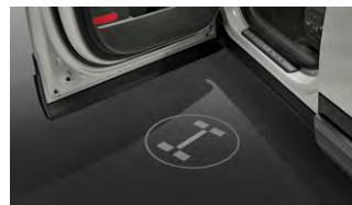
LED 도어스팟 램프