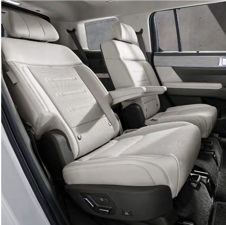
2열 전동 독립시트(윈터치 릴렉스, 윈타입 헤드레스트)

전동으로 시트 등받이 각도 조절(리클라이닝) 및 시트 쿠션 각도 조절(틸팅)이 가능하며 윈터치 릴렉스 모드가 적용되어 편리한 공간활용성과 편안한 후석 승객 자세를 제공합니다.