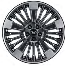
20인치알로이 휠 (AWD 하이브리드 전용)