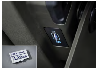
빌트인 캠 2 전용 마이크로SD 카드(128GB)