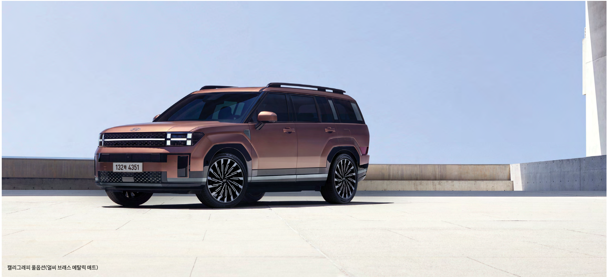
캘리그래피 풀옵션(얼씨 브래스 메탈릭 매트)

견고한 디자인에 미래 지향적인 디테일을 더해 신타페만의 압도적인 존재감을 전달합니다.