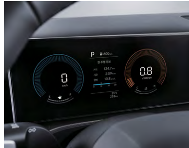
클러스터(4.2인치 컬러LCD) 파노라믹 커브드 디스플레이 / 클러스터(12.3인치 컬러 LCD)