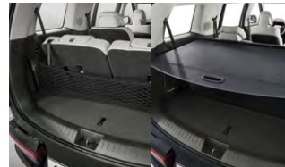
러기지 넷, 러기지 스크린