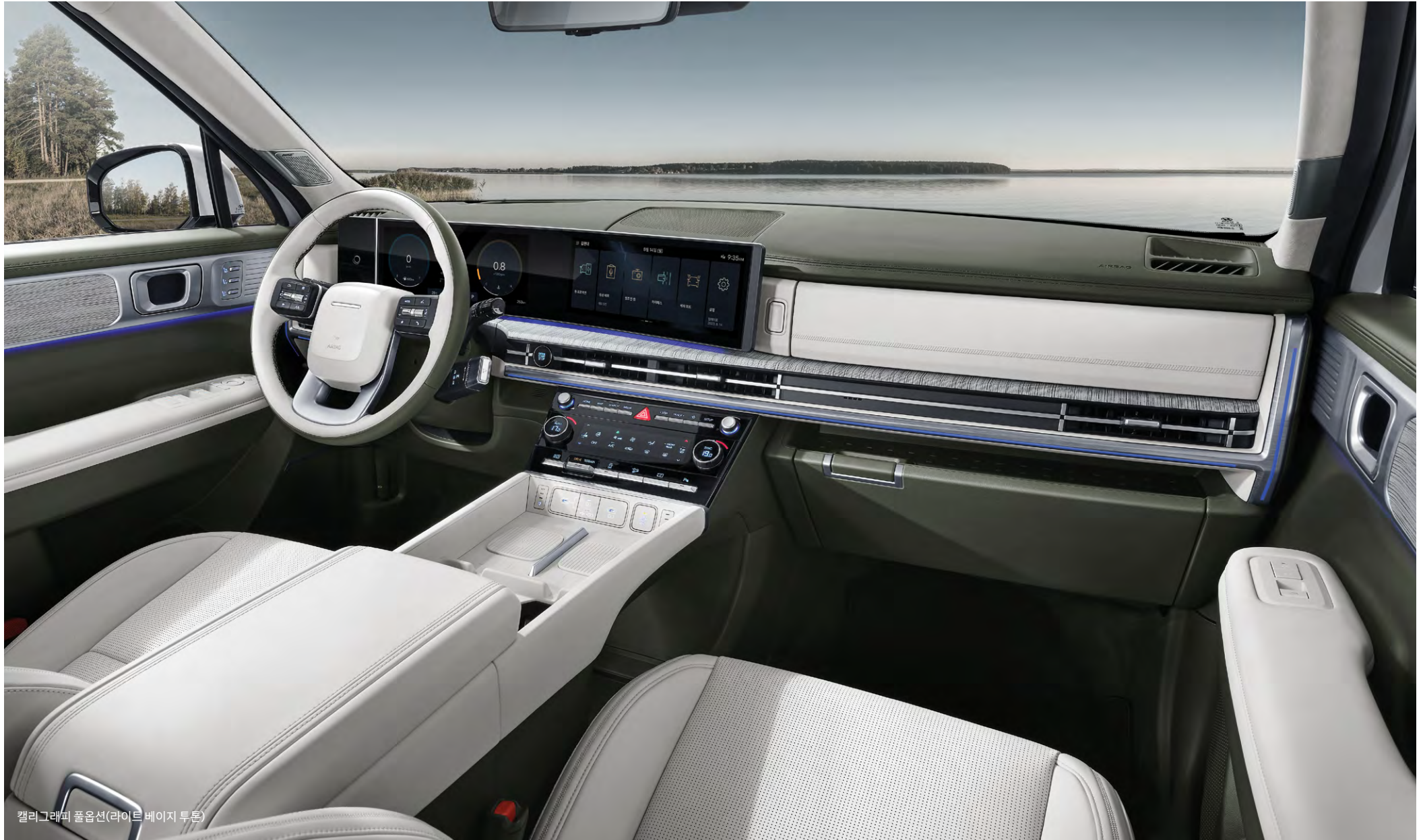
캘리그래피 풀옵션(라이트 베이지 투톤)

나파가족시트, 인조가족 적용 내장(멀티트레이 커버, 도어 암레스트, 콘솔 사이드부), 스웨이드 내장재(헤드라이닝/필라), 투톤 가죽 스티어링 휠, 메탈 도어 스커프, 메탈 레달, 앰비언트 무드램프