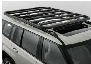
루프 플랫폼 바스켓