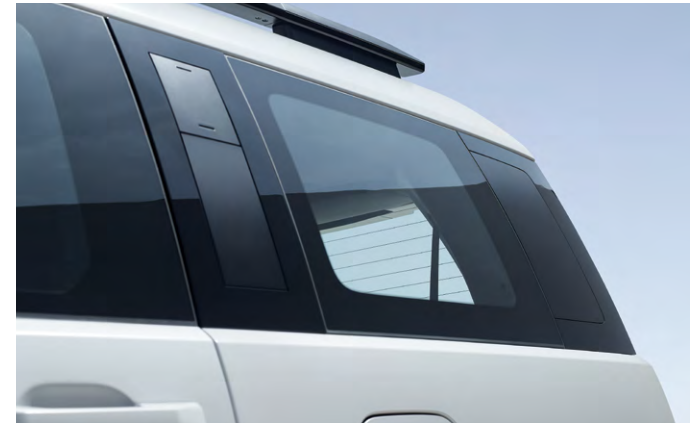
매트블랙메탈 C/D 필라가니쉬