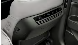
빌트인 공기청정기 2.0