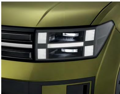
LED 헤드램프(MFR 타입) Full LED 헤드램프(프로젝션 타입)