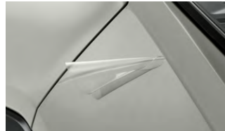
차량 보호 필름 I (프론트 범퍼 사이드 외)