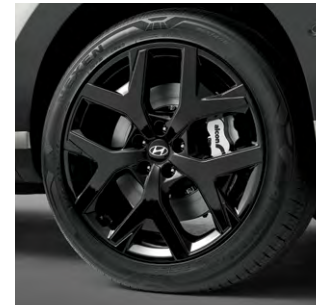
20인치 블랙 휠