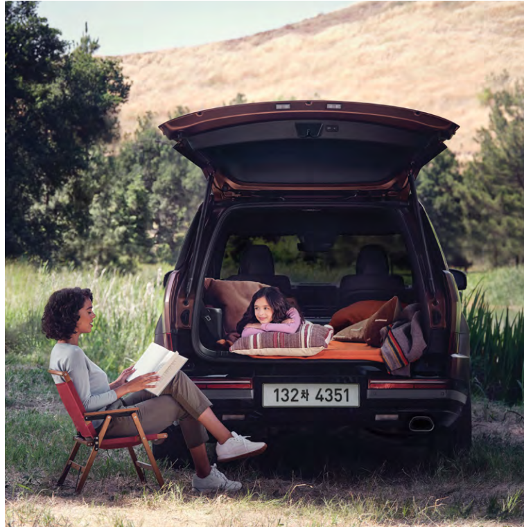
와이드 테일게이트 오프닝

전동으로 시트 등받이 각도 조절(리클라이닝) 및 시트 쿠션 각도 조절(틸팅)이 가능하며 윈터치 릴렉스 모드가 적용되어 편리한 공간활용성과 편안한 후석 승객 자세를 제공합니다.