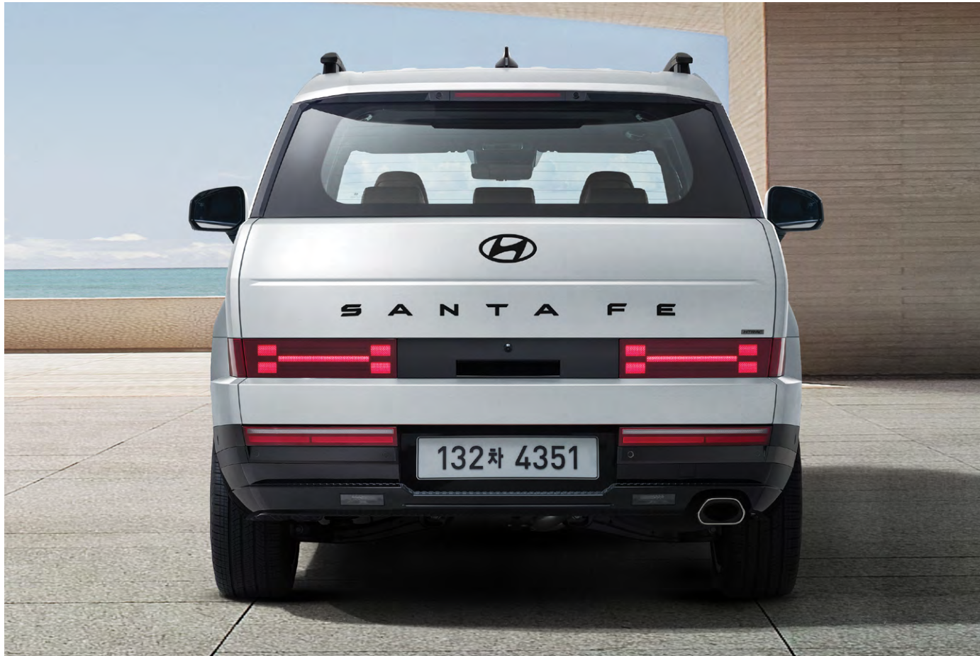
매트블랙메탈 H 엠블럼 & 레터링