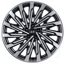
21인치알로이 휠 (가솔린 전용)