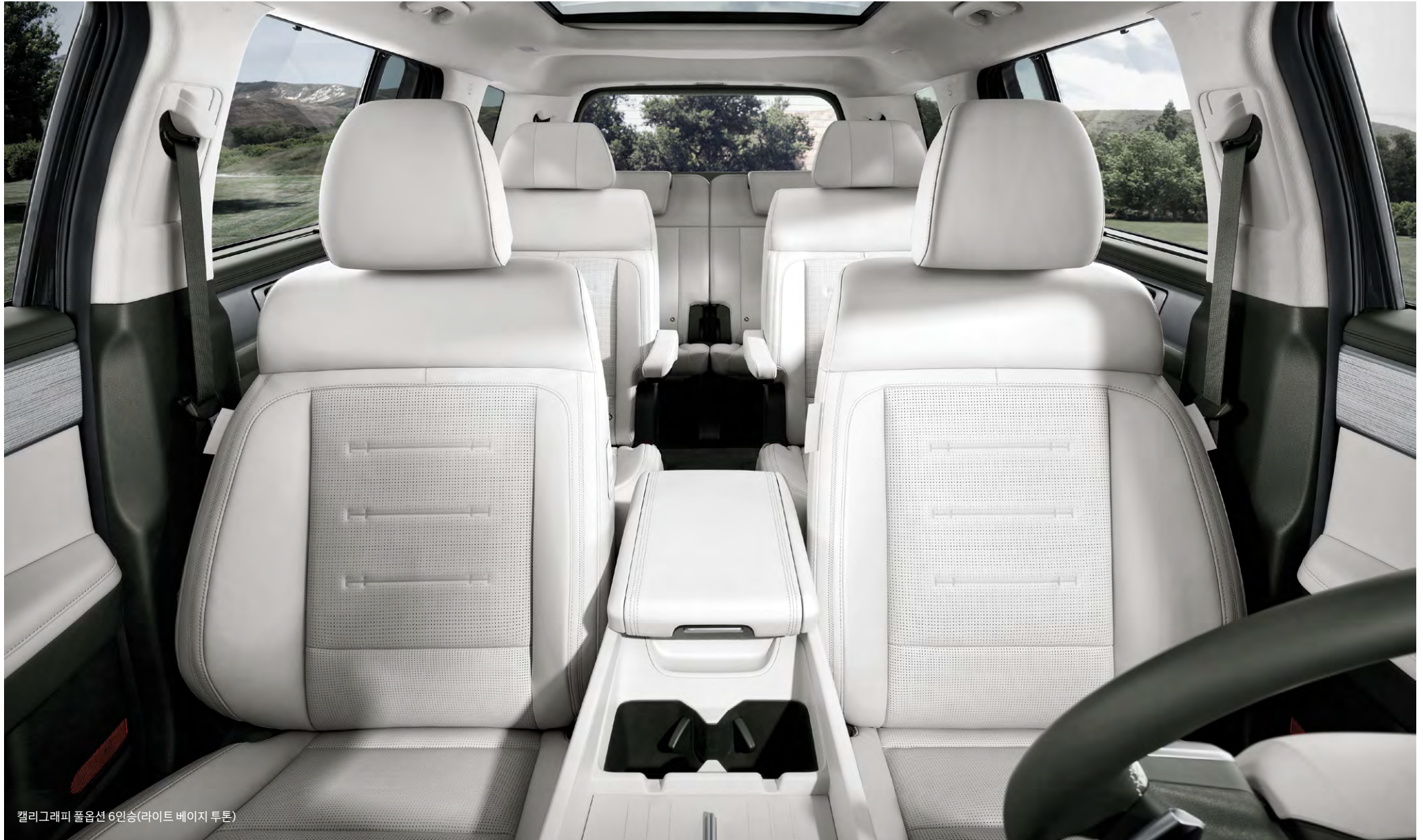
캘리그래피 폴업션 6인승(라이트 베이지 투톤)