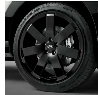
21인치 블랙 휠