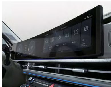
클러스터(4.2인치 컬러LCD) 파노라믹 커브드 디스플레이 / 클러스터(12.3인치 컬러 LCD)