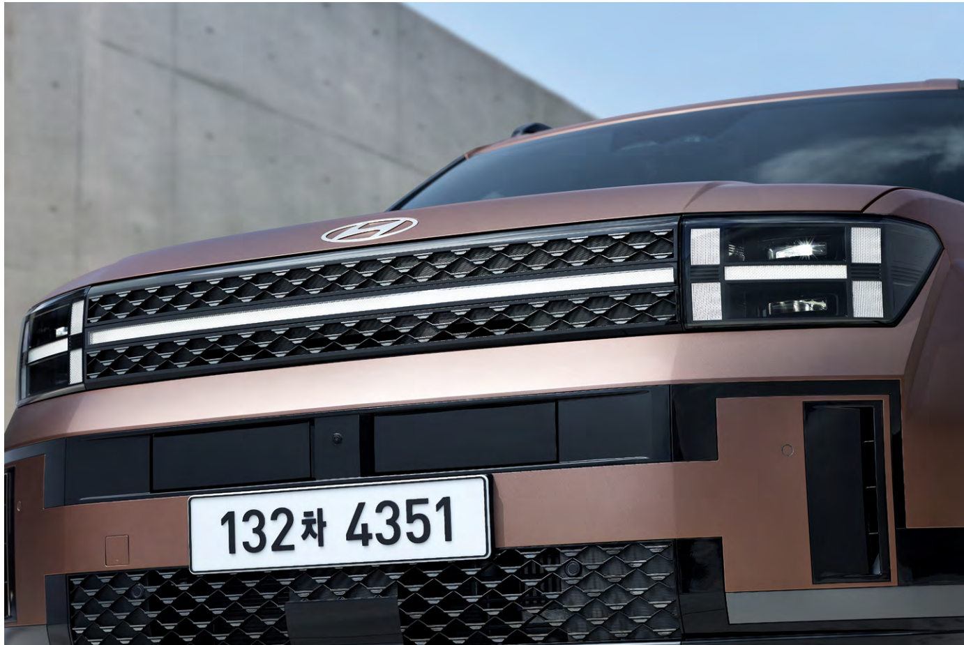
수평형 LED 램프(포지셔닝램프) & Full LED 헤드램프(프로젝션 타입)