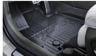
플로어 매트 1, 2열