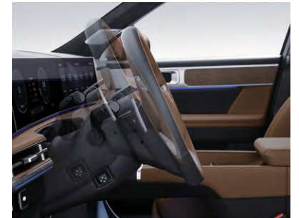
전동식 틸트 & 텔레스코픽 스티어링 휠 BOSE 프리미엄 사운드(12스피커, 외장 앰프)