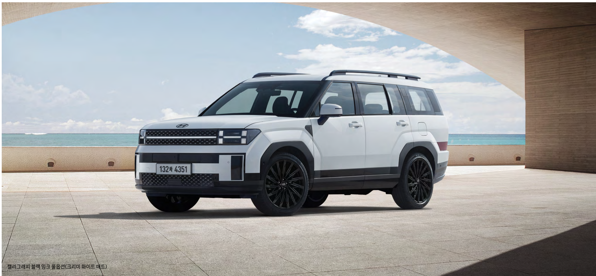
캘리그래피 블랙 인크 풀옵션(크리미 화이트 매트)

내·외장 트림에 블랙 색상(All black)을 적용하여 정갈한 수묵화와 같은 정제된 아름다움을 표현하였습니다.