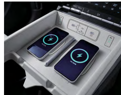
스마트폰 무선 충전(싱글) 스마트폰 무선 충전(듀얼)