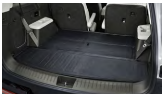
리버서블 러기지 매트