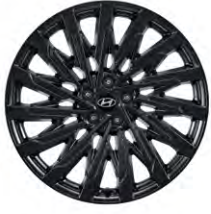
21인치알로이 휠 (가솔린 블랙잉크 전용)