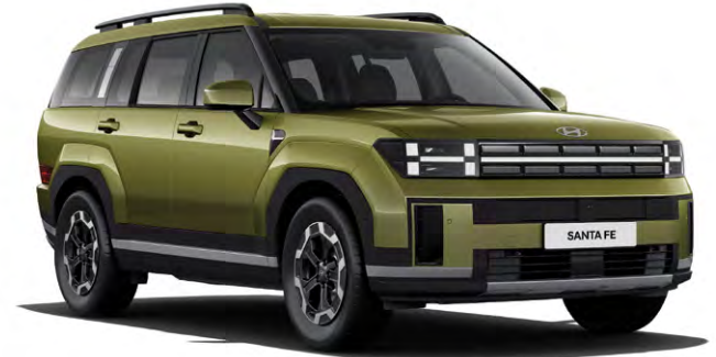
프레스티지(올리브 그린 펠)