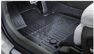
플로어 매트 1, 2열