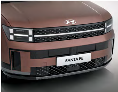
라디에이터 & 인테이크 그릴 블랙 하이그로시 클레딩 & 티타늄메탈 가니쉬