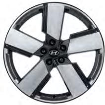
20인치 알로이 휠 (가솔린/AWD 하이브리드 옵션)