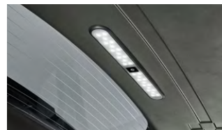
LED 테일게이트 램프