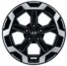
18인치 알로이 휠 (가솔린 전용)