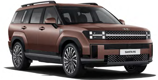
캘리그래피 풀옵션(일시 브래스 메탈릭 매트)