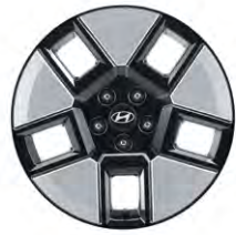
18인치 알로이 휠 (하이브리드 전용)