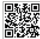
현대인증중고차 기존 차량 매입 안내