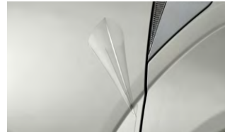
차량 보호 필름 II (도어 중앙부, 도어 엣지 외)