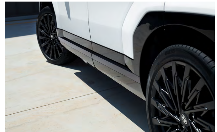
매트블랙메탈 도어 사이드 가니쉬