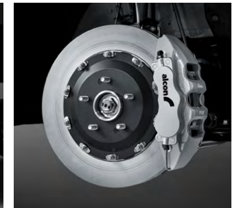
알콘(alcon) 모노블록 브레이크 시스템