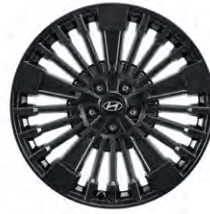
20인치알로이 휠 (AWD 하이브리드 블랙잉크 전용)