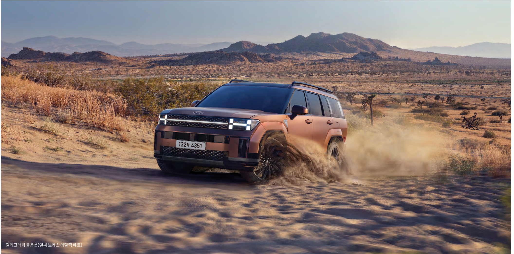
캘리그래피 풀옵션(얼시 브래스 메탈릭 매트)