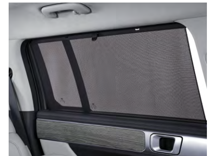
양방향 멀티 콘솔 2열 수동식 도어 커튼