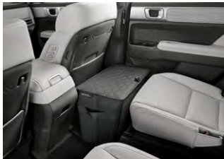
2열 레그룸 박스