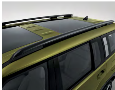
라디에이터 & 인테이크 그릴 듀얼 와이드 선루프 & 루프랙