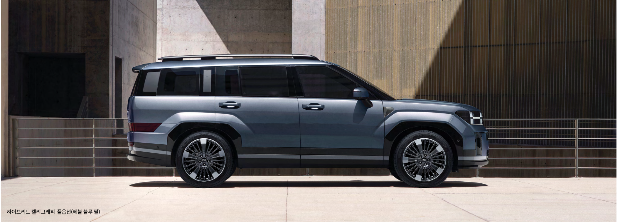
하이브리드 캘리그래피 풀업션(페블 블루 펄)

e-Motion Drive의 하이브리드 특화 기술로 진보된 주행 성능을 제공합니다.