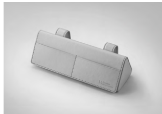
선바이저 선글라스 케이스