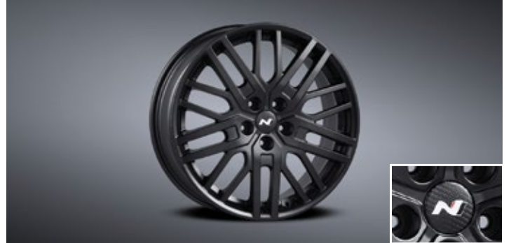
19인치 블랙 경량 휠 & 리얼 카본 휠캡