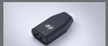
C to USB-A 변환 젠더

※ 위 H Genuine Accessories는 쏘나타 N Line 차량에도 적용 가능합니다. ※ LED 라이팅 플러스 패키지의 도어스윙 램프는 1열에만 적용됩니다. ※ C to USB-A 변환 젠더는 현대자동차 전용 개발 제품으로 타 제품 및 타 자동차 브랜드에서는 작동을 보장하지 않습니다. ※ H Genuine Accessories 신차 옵션 상품 선택 시 납량, 철국, 영남 출고센터에서만 출고가 가능합니다. ※ 위 상품은 트림 및 옵션 선택에 따라 적용 가능 여부가 달라질 수 있습니다. 자세한 사항은 해당 월의 가격표를 참고해 주시기 바랍니다. ※ H Genuine Accessories 신차 옵션 상품 선택 시 기존에 장착된 부품의 처리 비용은 해당 패키지 판매가격에 반영되어 있어 별도의 보상은 없습니다.