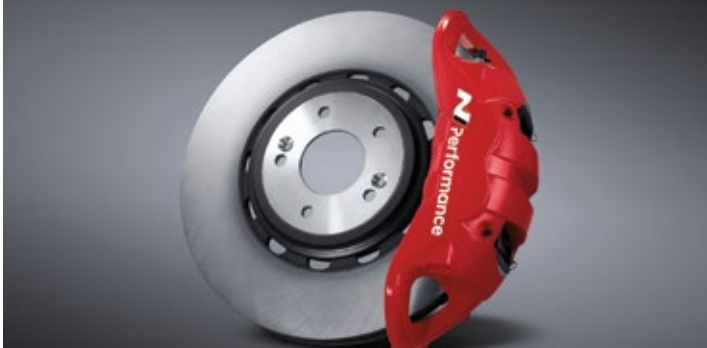
모노블록 4P 캘리퍼 & 하이브리드 디스크 & 로우 스틸 패드