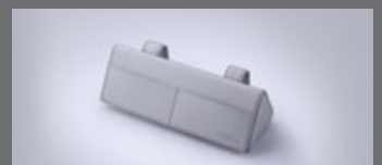
선바이저 선글라스 케이스