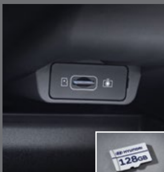
빌트인 램프 2 전용 마이크로SD 카드(128GB)