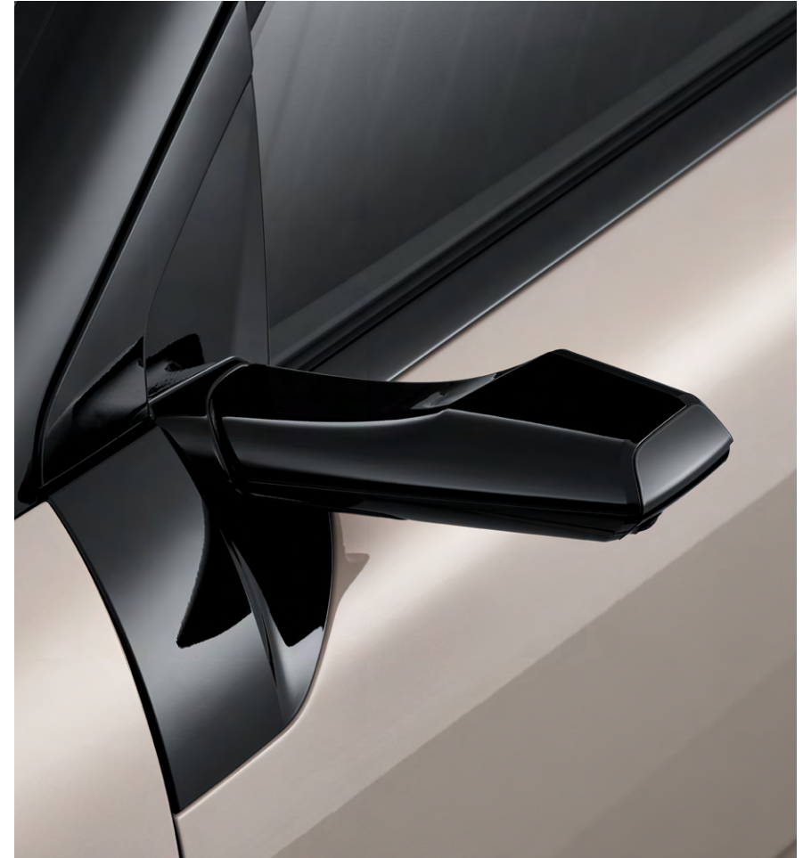
디지털 사이드 미러(카메라 및 OLED 모니터)

* 상기 이미지는 LED 포지셔닝 램프, LED 주간주행등만 점등된 이미지입니다.