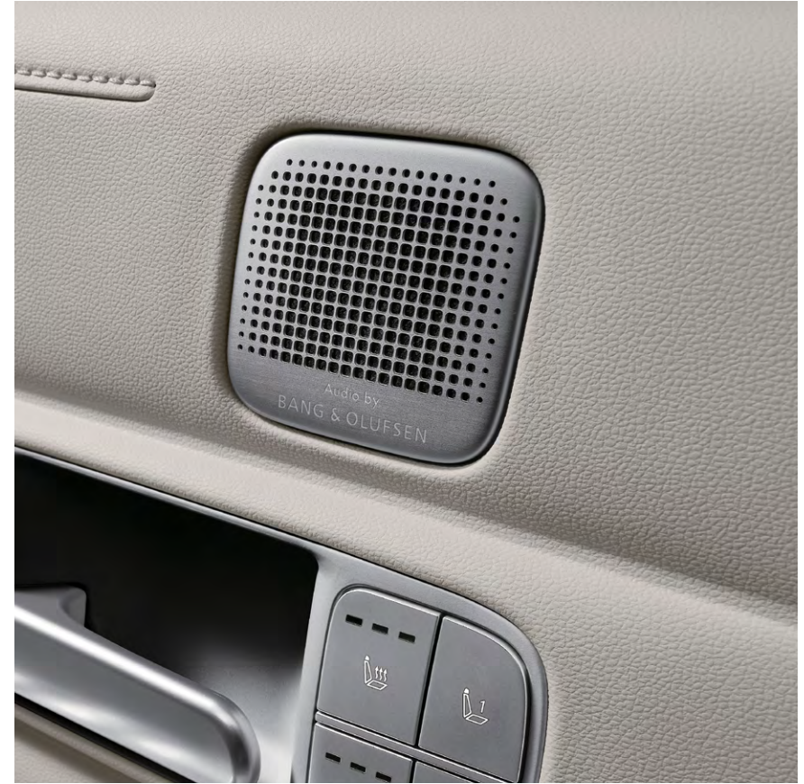
Audio by Bang & Olufsen 프리미엄 사운드(14스피커, 외장앰프 포함)