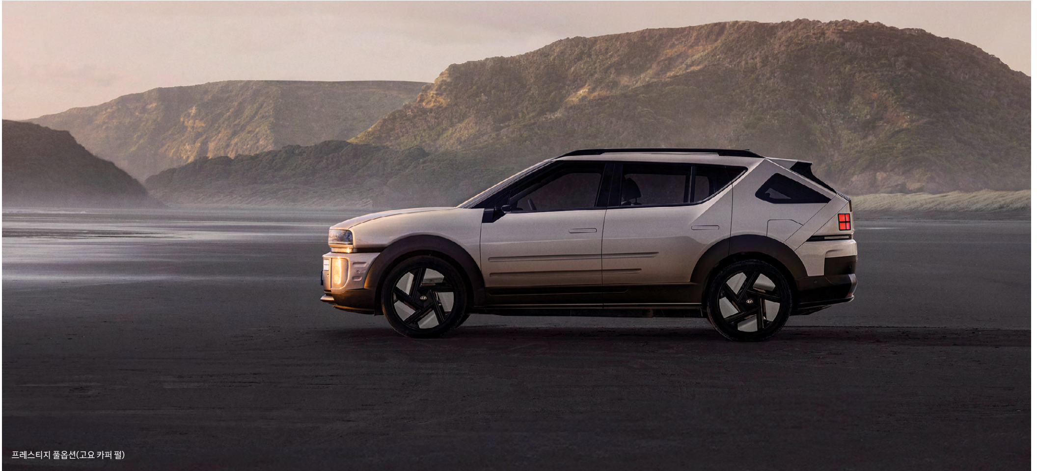
프레스티지 풀옵션(고요 카퍼 펠)

* 아트 오브 스틸(ART OF STEEL)은 소재 그대로 철의 탄성을 살려 형태적인 아름다움으로 승화시키는 디 올 뉴 넥쏘의 디자인 아이덴티티입니다.