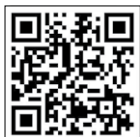
NEXO 디지털 카탈로그 (PC/태블릿)