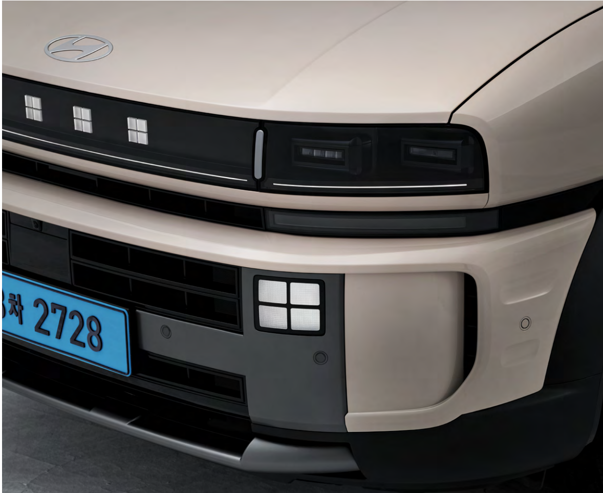
Full LED 헤드램프(프로젝션 타입, 지능형 헤드램프/다이내믹 웰컴, 에스코트 라이트 포함)

* 상기 이미지는 LED 포지셔닝 램프, LED 주간주행등만 점등된 이미지입니다.