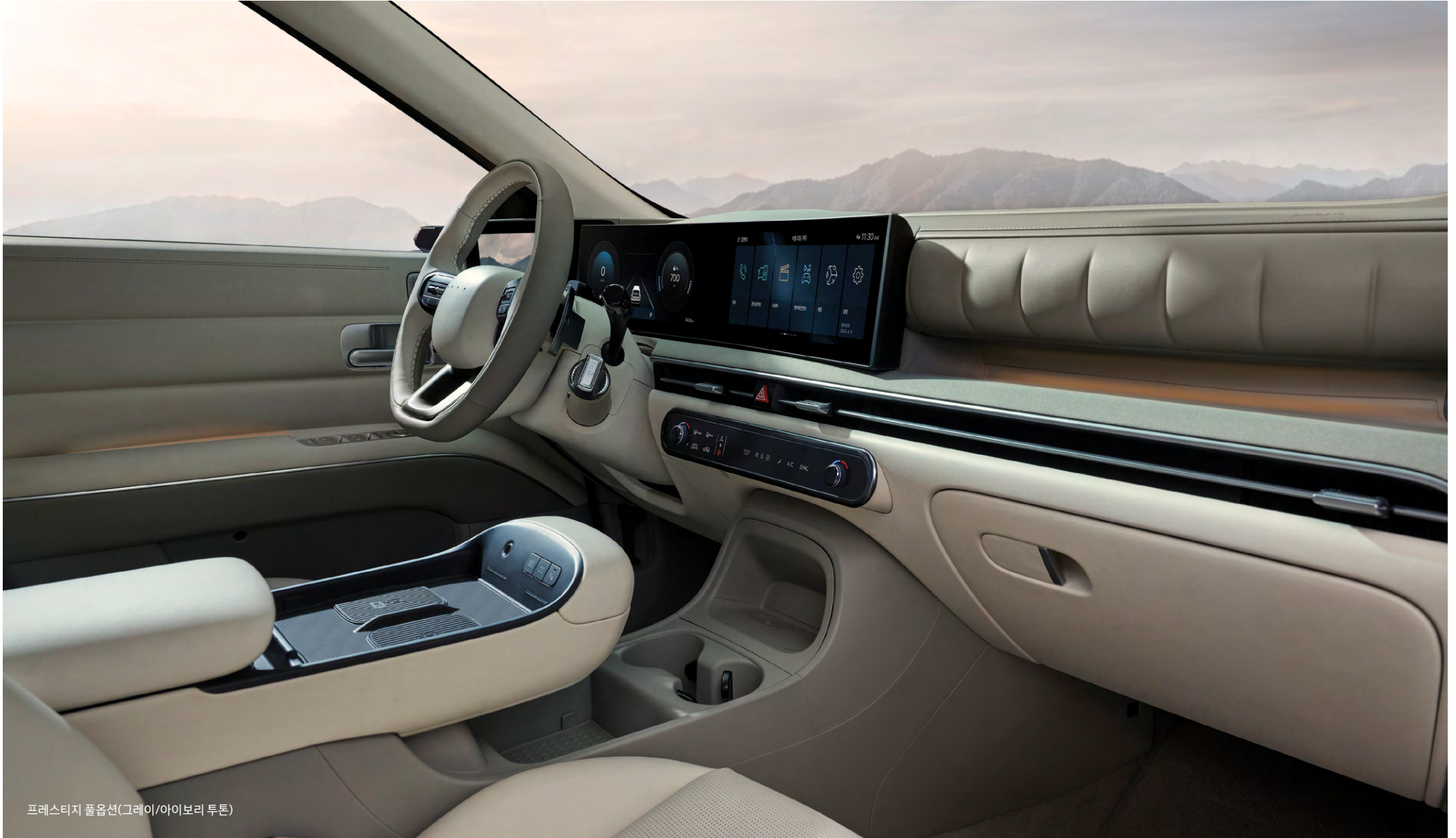
프레스티지 폴옵션(그레이/아이보리 투톤)

파노라믹 커브드 디스플레이, 헤드업 디스플레이, 1/2열 열선/통풍시트, 스마트폰 무선충전(듀얼), 앰비언트 무드램프, ANC-R, 동승석 워크인 디바이스, 실내 지문 인증 시스템(개인화, 시동, 결제 등), 에코 프로세스 천연가죽 시트, 친환경 스웨이드 내장재(헤드라이닝/선바이저)