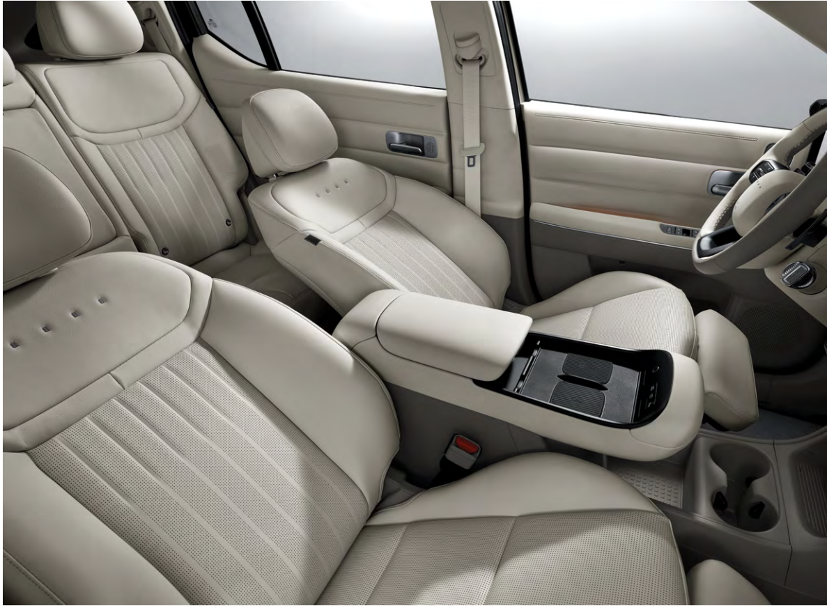
1열 릴렉션 컴포트 시트(레그레스트)

흠 인테리어 감성의 현대적이면서도 편안한 분위기 속에서 다채로운 라이프스타일을 누리는 여유로운 공간을 완성하였습니다.