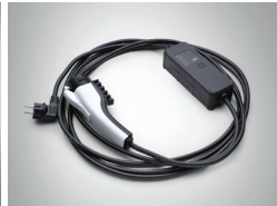
220V 휴대용 완속 충전 케이블