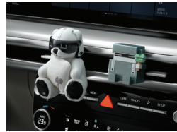
아이오닉 캐릭터 디퓨저