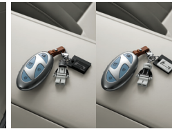
아이오닉 브릭토이 키체인

※ 후석 스마트 엔터테인먼트 시스템은 제공 가능한 OTT 스트리밍 콘텐츠의 경우 콘텐츠 제공자의 사정에 따라 변동 혹은 중단될 수 있습니다. ※ 후석 스마트 엔터테인먼트 시스템은 각 OTT별 이용권을 별도 구매하여 이용 중인 경우에만 사용 가능합니다. ※ 후석 스마트 엔터테인먼트 시스템은 블루링크 서비스(5년 무료 제공) 및 스트리밍 플러스 가입을 통해 주요 기능 이용이 가능합니다. ※ 후석 스마트 엔터테인먼트 시스템은 블루링크 서비스 가입 후 스트리밍 플러스 미 가입 시에는 와이파이 핫스팟 및 별도 무선 네트워크 연결이 필요합니다. ※ 트레일러 패키지 선택의 커넥터는 유럽식 13PIN 적용되어 있으며 토우볼 지름은 50mm입니다. ※ H Genuine Accessories 신차 옵션 상품 선택 시 전차종 별도 명기되지 않는 한 남양, 철국, 영남 출고센터에서만 출고가 가능합니다. ※ H Genuine Accessories 신차 옵션 상품 선택 시 기존에 장착된 부품의 처리비용은 해당 패키지 판매가격에 반영되어 있어 별도의 보상은 없습니다.