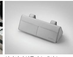
선바이저 선글라스 케이스