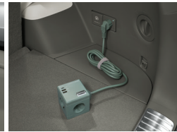
아이오닉 큐브 멀티플러그