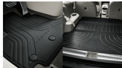
플로어 매트 1/2열, 라기지 매트