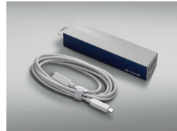
100W 충전 케이블