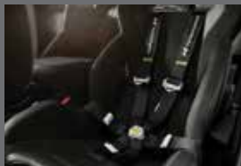
Sabelt 6점식 시트벨트