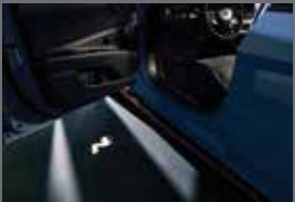
N 퍼포먼스 도어 스팟 램프 (N)