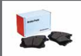
FERODO 브레이크 패드