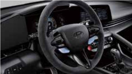
알칸타라 스티어링 휠