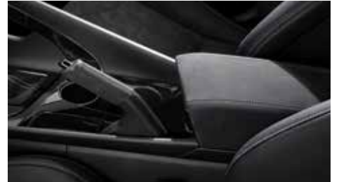
알칸타라 파킹레버 & 센터콘솔