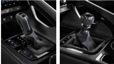
알칸타라 기어 노브 & 부츠