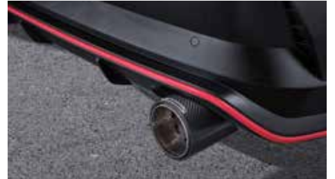
카본 리어 머플러팁