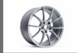
18인치 단조 휠 (실버)