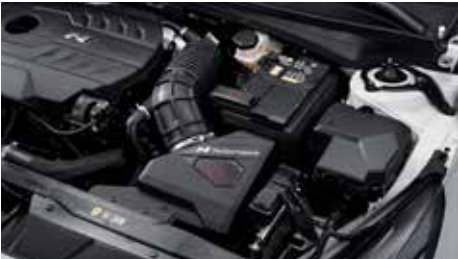
고성능 흡기 시스템