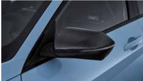
카본 사이드 미러