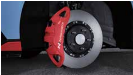
N 퍼포먼스 브레이크 시스템 (모노블록 4피스톤 캘리퍼, 불팅타입 하이브리드 디스크)