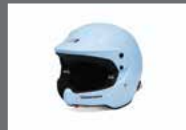
Stilo Venti WRC 헬멧