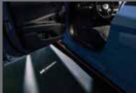
N 퍼포먼스 도어 스팟 램프 (N Performance)