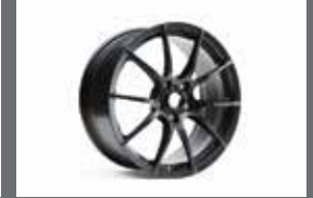
18인치 단조 휠 (블랙)