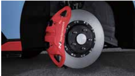
N 퍼포먼스 브레이크 시스템 (모노블록 4피스톤 캘리퍼, 불팅타입 하이브리드 디스크)