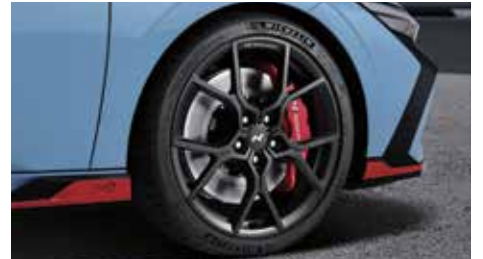
19인치 매트 블랙 단조 휠(리얼 카본 휠캡) *휠 단품 구매 가능(227만원)