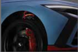
H&R 로워링 스프링

※ 애프터마켓 상품 판매처 : N 퍼포먼스 Shop(nperformanceshop.com)