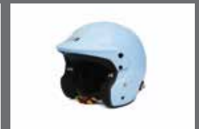
Stilo Venti Trophy 헬멧