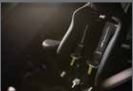
Sabelt 4점식 시트벨트