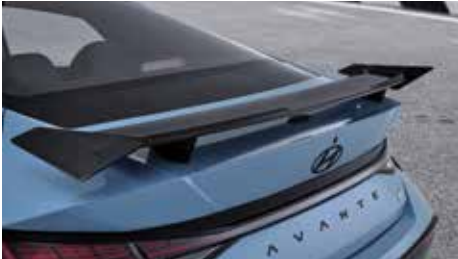
카본 리어 스포일러