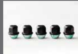
N 퍼포먼스 휠 너트 M12 [블랙]