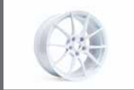
18인치 단조 휠 (화이트)