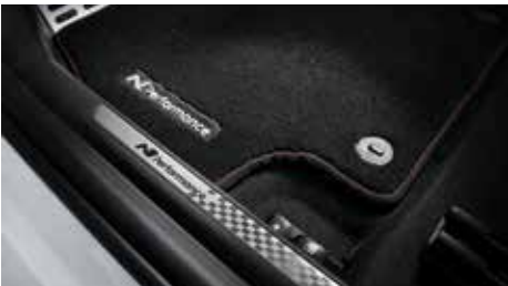
N 퍼포먼스 전용 매트 & 메탈 도어스커프