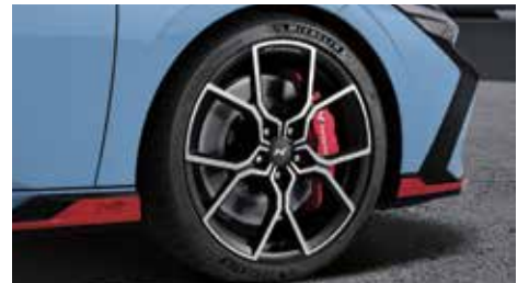
19인치 전면가공 단조 휠(리얼 카본 휠캡) *휠 단품 구매 가능(242만원)