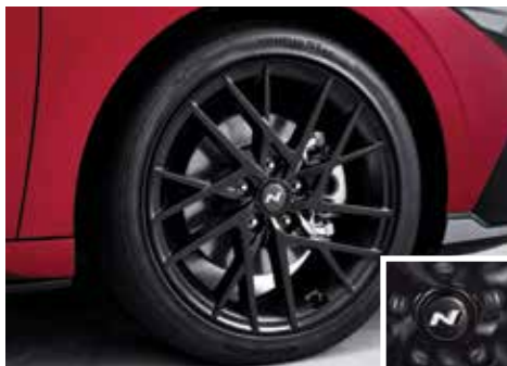
18인치 스포츠 디자인 휠 & N로고 스피닝 휠캡