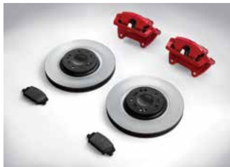
레드 캘리퍼 & 대용량 디스크 & 로우 스틸 패드