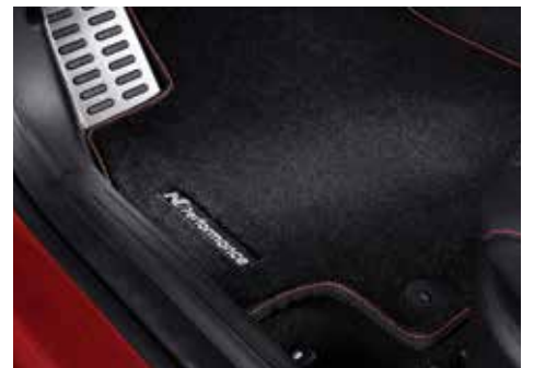
N로고 플로어 매트(1열, 2열)

※ 상기 N Performance parts 상품은 N Line 차량에만 적용 가능합니다.