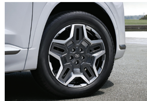
19" Aero type alloy wheels ล้ออัลลอยดีไซน์สปอร์ตทูโทน ขนาด 19 นิ้ว