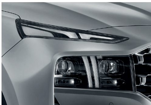
Stacked daytime running lights & headlights ไฟหน้าและไฟ Daytime running lights ส่องสว่างในเวลากลางวัน และให้แสงสว่างถึงขีดสุดในเวลากลางคืน