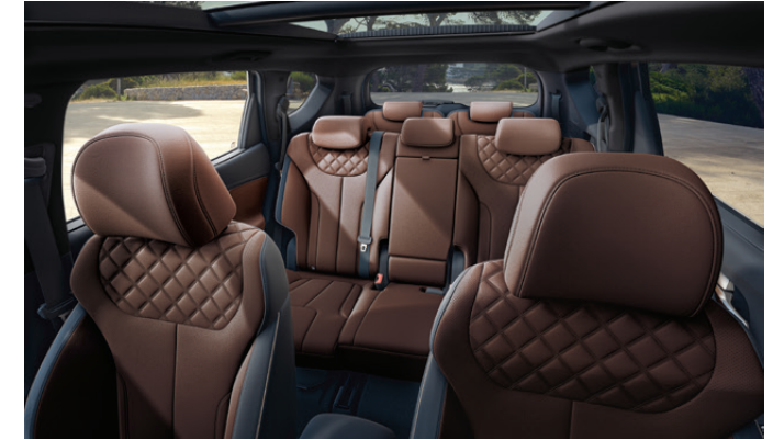
Cognac brown two-tone

เบาะนั่งหุ้มหนังสีน้ำตาลเคลือบยัดด้วยฮีต่า 7 ที่นั่ง