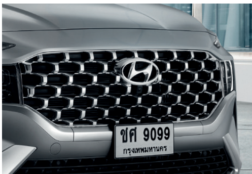
Cascade front grille กระจังหน้าดีไซน์หรูโดดเด่นเฉพาะตัว