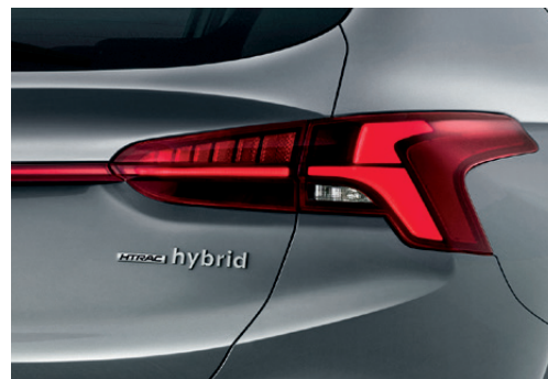
LED rear combination lights ไฟท้ายแบบ LED ช่วยเพิ่มความปลอดภัย และประหยัดพลังงาน ให้ความสว่างคมชัดยิ่งขึ้นในยามค่ำคืน