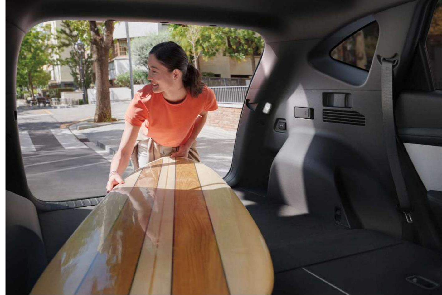
Складываемые сиденья / Функция дистанционного складывания