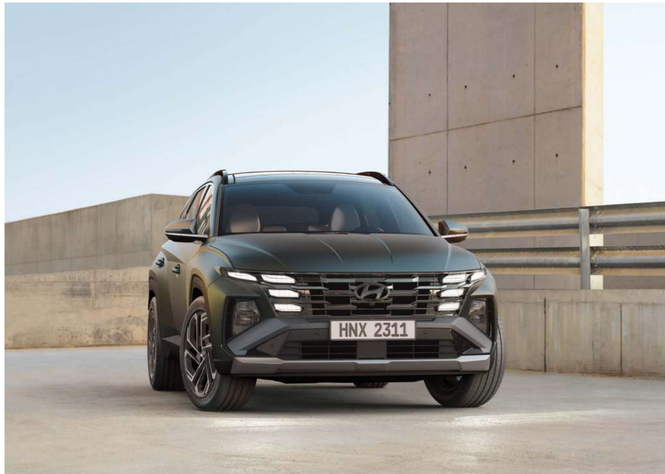
Параметрический дизайн фирменных огней / Решетка радиатора / Передний бампер

Скажите «нет» обыденности благодаря выразительным элементам фронтальной оптики и боковых панелей кузова, напоминающим огранку драгоценного камня. Смелое обновление дизайна позволит вам ярко выделиться на общем фоне.