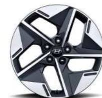
18-дюймовые легкосплавные колесные диски