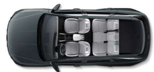
Стандартная компоновка салона