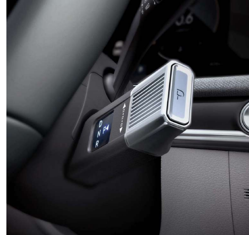
Рычаг селектора передач на рулевой колонке (SBW)