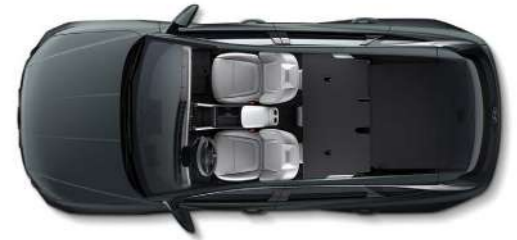
Полностью сложенные задние сиденья