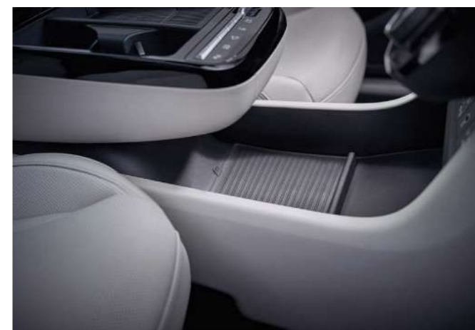
Атмосферная подсветка / Отсек в центральной консоли Парящая консоль