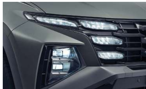
Полностью светодиодные фары головного света (широкий угол освещения и интеллектуальная система управления светом IFS)