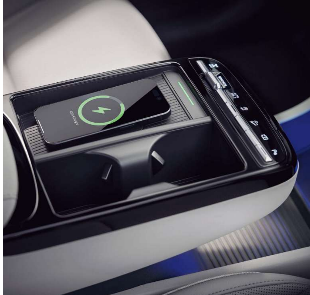
Беспроводное зарядное устройство

Новый подход к компоновке салона и набор интуитивных технологий гарантируют вам легкую и удобную эксплуатацию автомобиля.