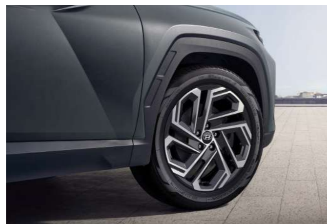
Рейлинги на крыше / Панорамная крыша с люком 19-дюймовые легкосплавные колесные диски