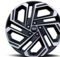
19-дюймовые легкосплавные колесные диски