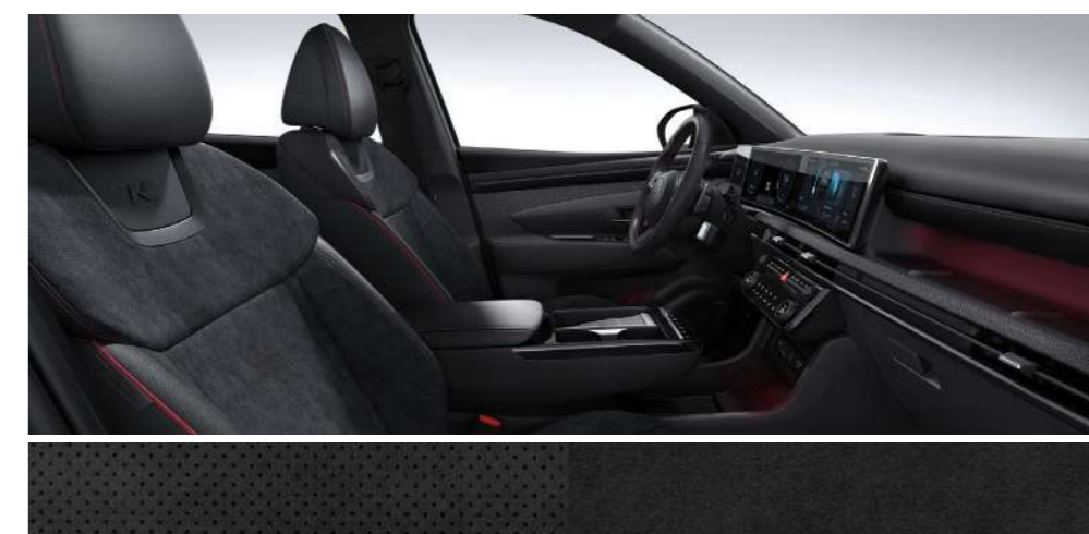
Черный (замша + кожа) с красной прострочкой