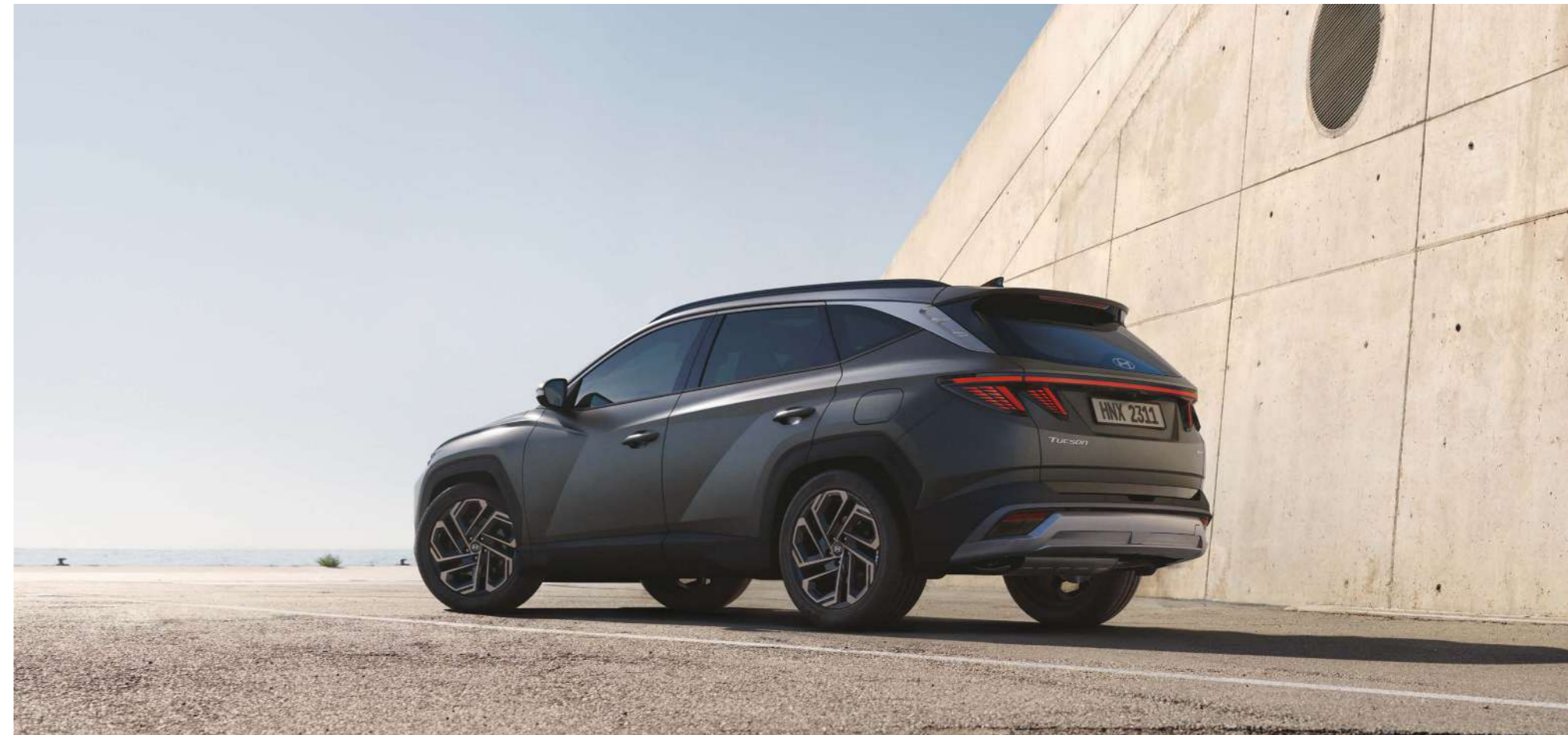
Светодиодные задние комбинированные фонари / Задний бампер / Параметрический дизайн панелей кузова