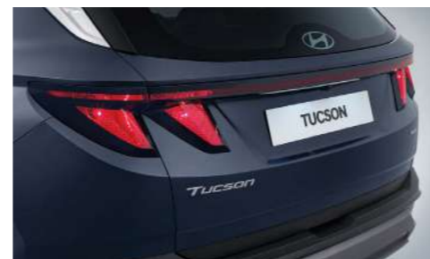
Комбинированные задние фонари (с галогеновыми лампами)