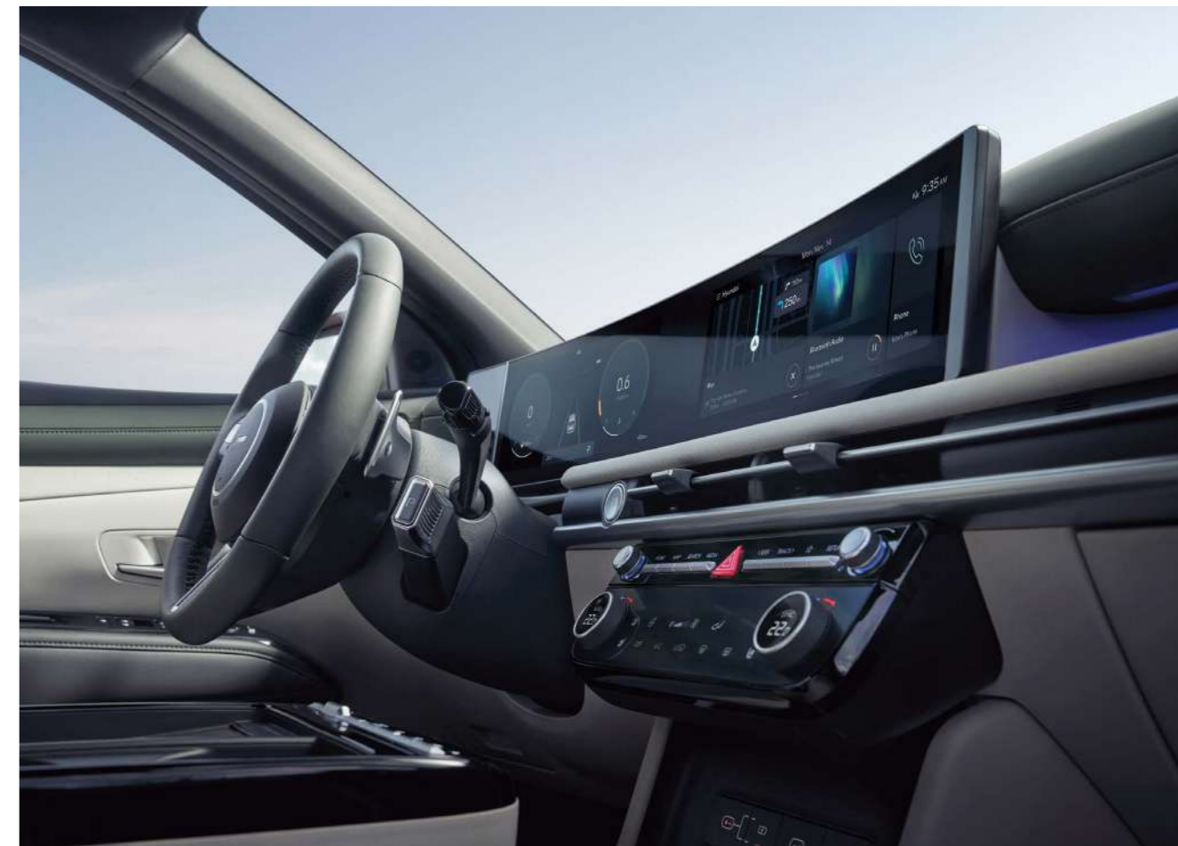
Панорамный изогнутый дисплей: приборная панель диагональю 12,3 дюйма и центральный дисплей диагональю 12,3 дюйма