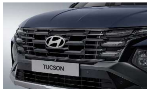
Черная решетка радиатора (дневные ходовые огни Clear Type)