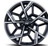
19-дюймовые легкосплавные колесные диски (версия N Line)