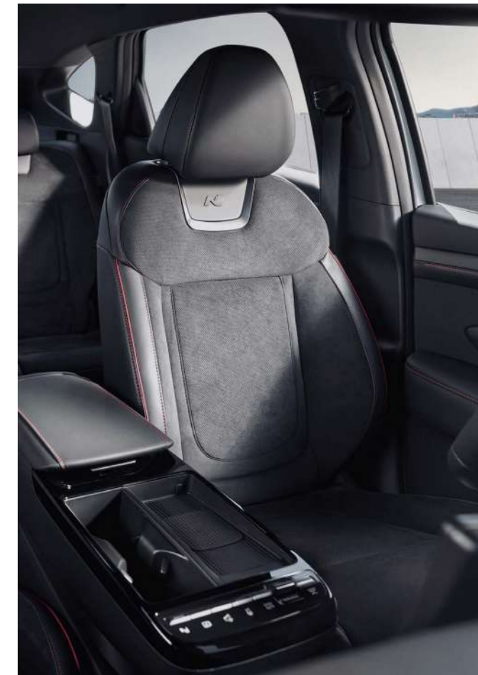
Эксклюзивная обивка сидений замшей N Line