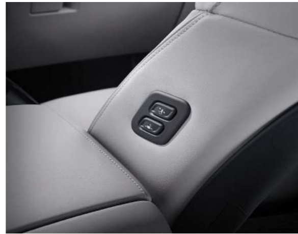
Интегрированная система запоминания положения сидений Упрощенная система доступа (для пассажира)