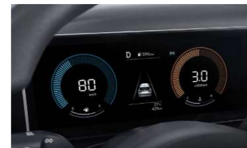
4,2-дюймовый ЖК-дисплей панели приборов