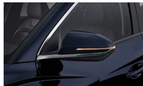
Светодиодные указатели поворота в корпусе зеркал заднего вида