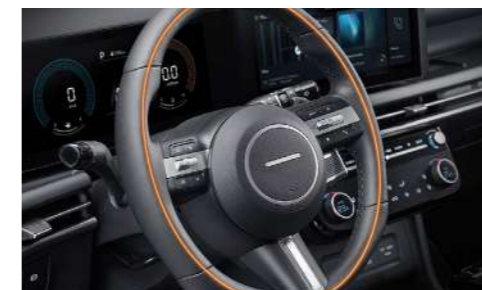
Рулевое колесо с подогревом