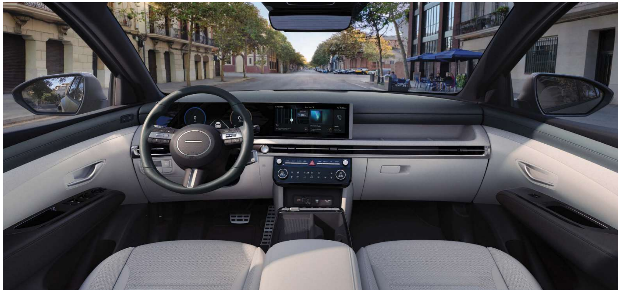
Окружающая архитектура интерьера

Широкий горизонтальный дизайн интерьера окружает пассажиров единой архитектурой, в которой соединяются технологии и стиль.