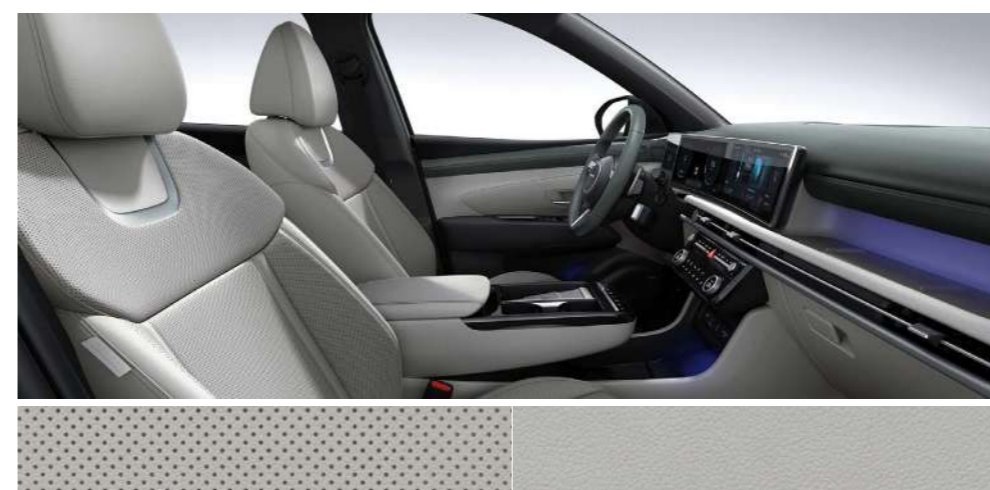
Зеленый трехцветный (кожа)