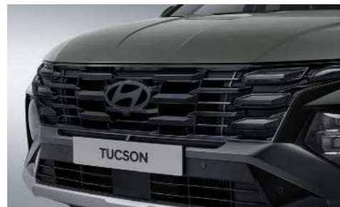
Решетка радиатора с черным хромированием (дневные ходовые огни Hidden Lighting)