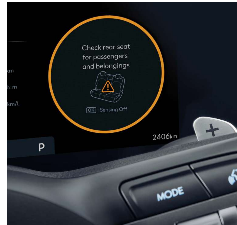
Функция предупреждения о присутствии пассажиров на задних сиденьях (ROA)