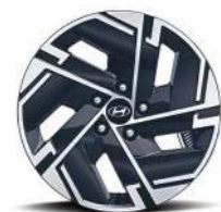
17-дюймовые легкосплавные колесные диски (NXe)