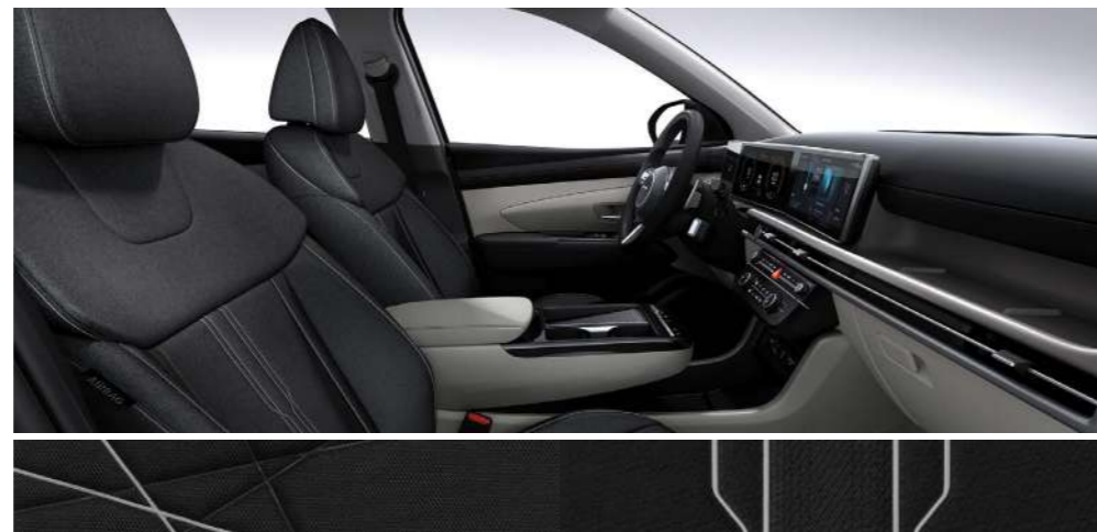
Серо-черный двухцветный (ткань)