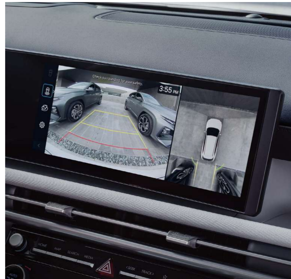
Система кругового обзора (SVM)