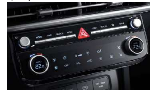
Полностью автоматическая система кондиционирования