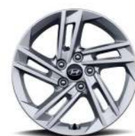
17-дюймовые легкосплавные колесные диски (NX4)