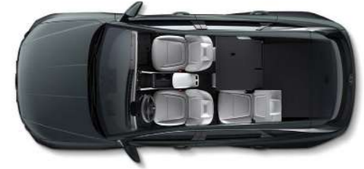
Складывание спинок в соотношении 6:4