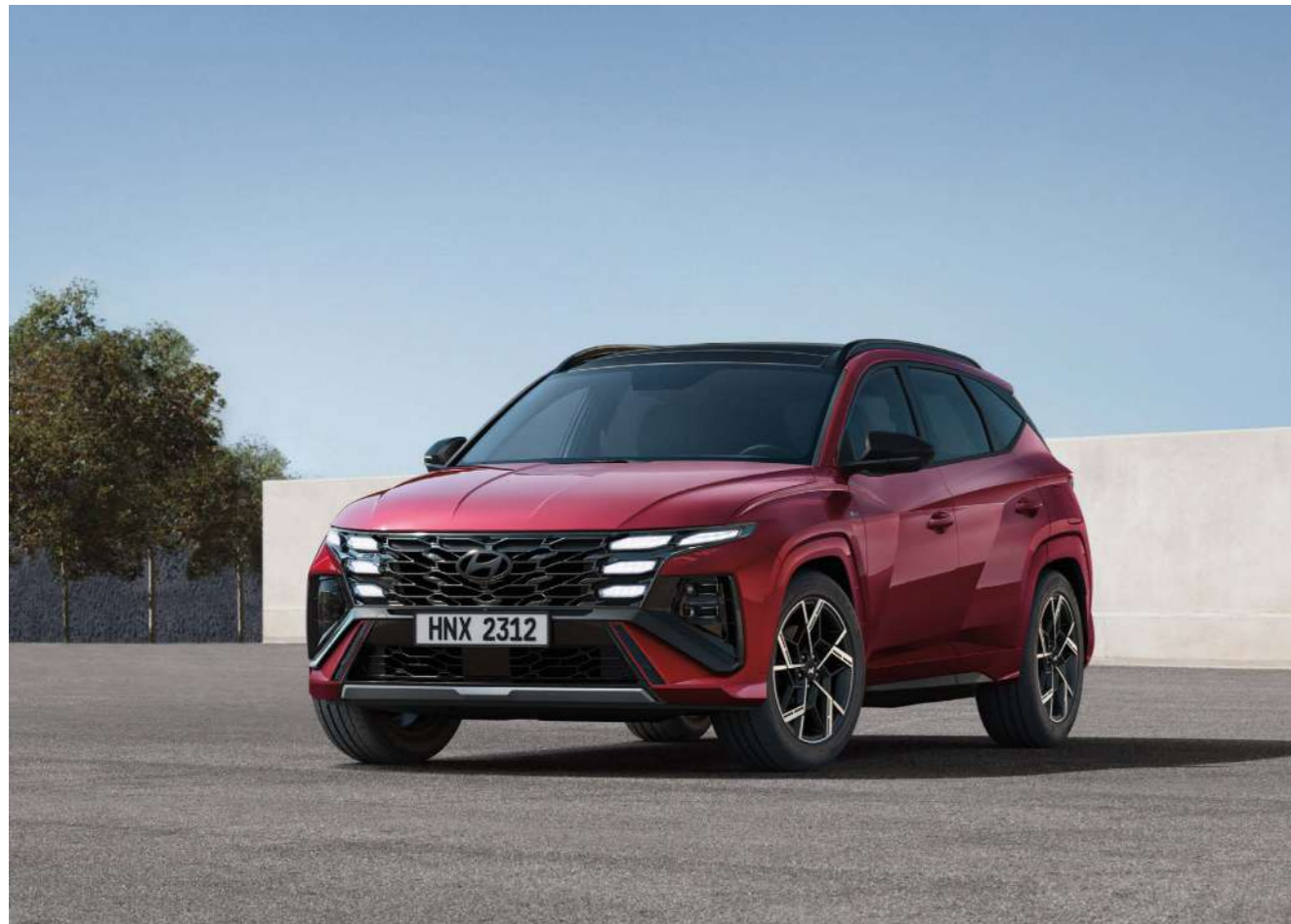
Эксклюзивная решетка радиатора N Line

Новый TUCSON N Line получил эксклюзивный дизайн и ждет встречи с теми, кто предпочитает дополнительные штрихи спортивности.