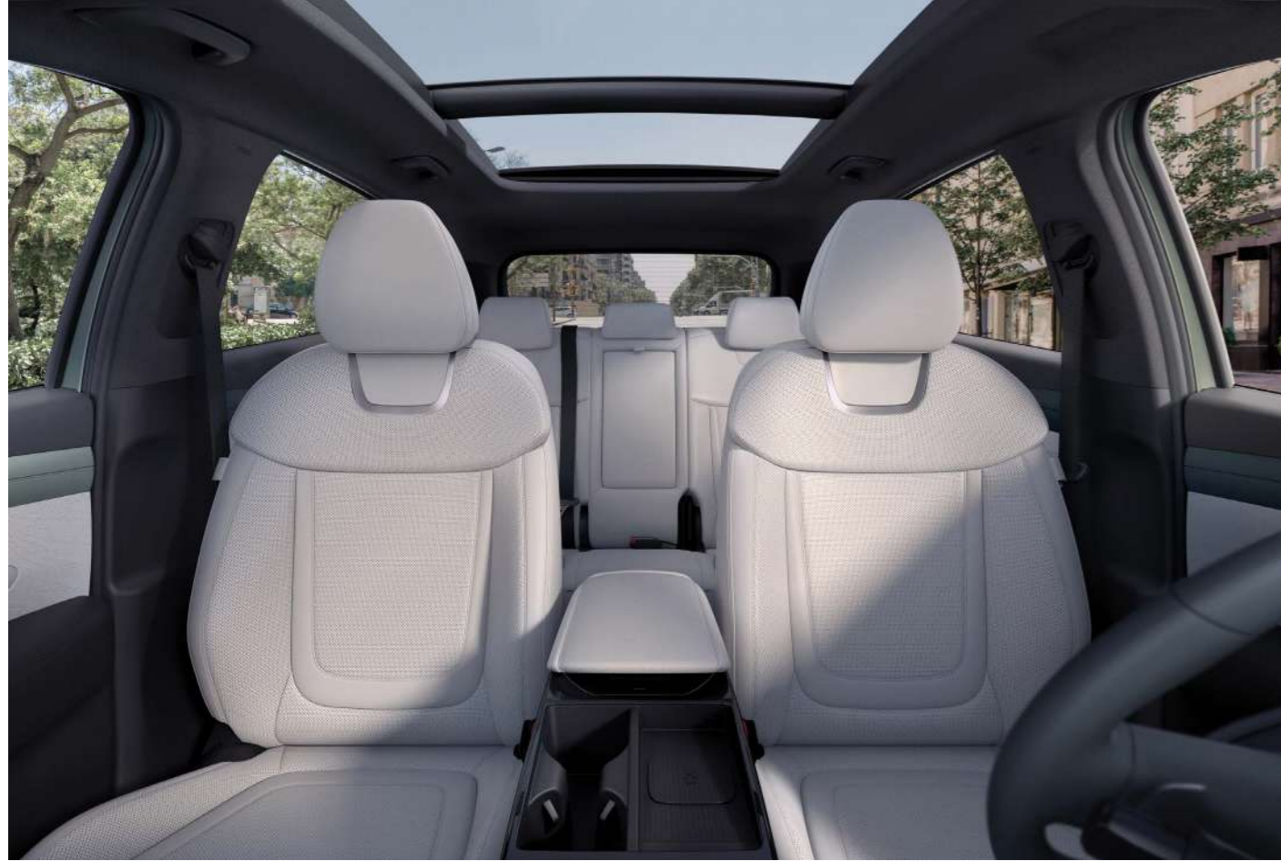
Передние и задние сиденья

Освободите место для большего. Лучшие в классе показатели вместительности багажника и салона подойдут для разных стилей жизни и занятий, обеспечивая непревзойденную универсальность.