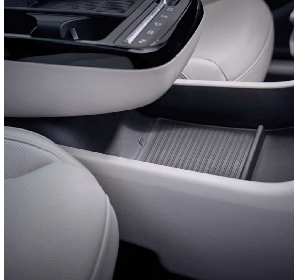
Удобное место для хранения