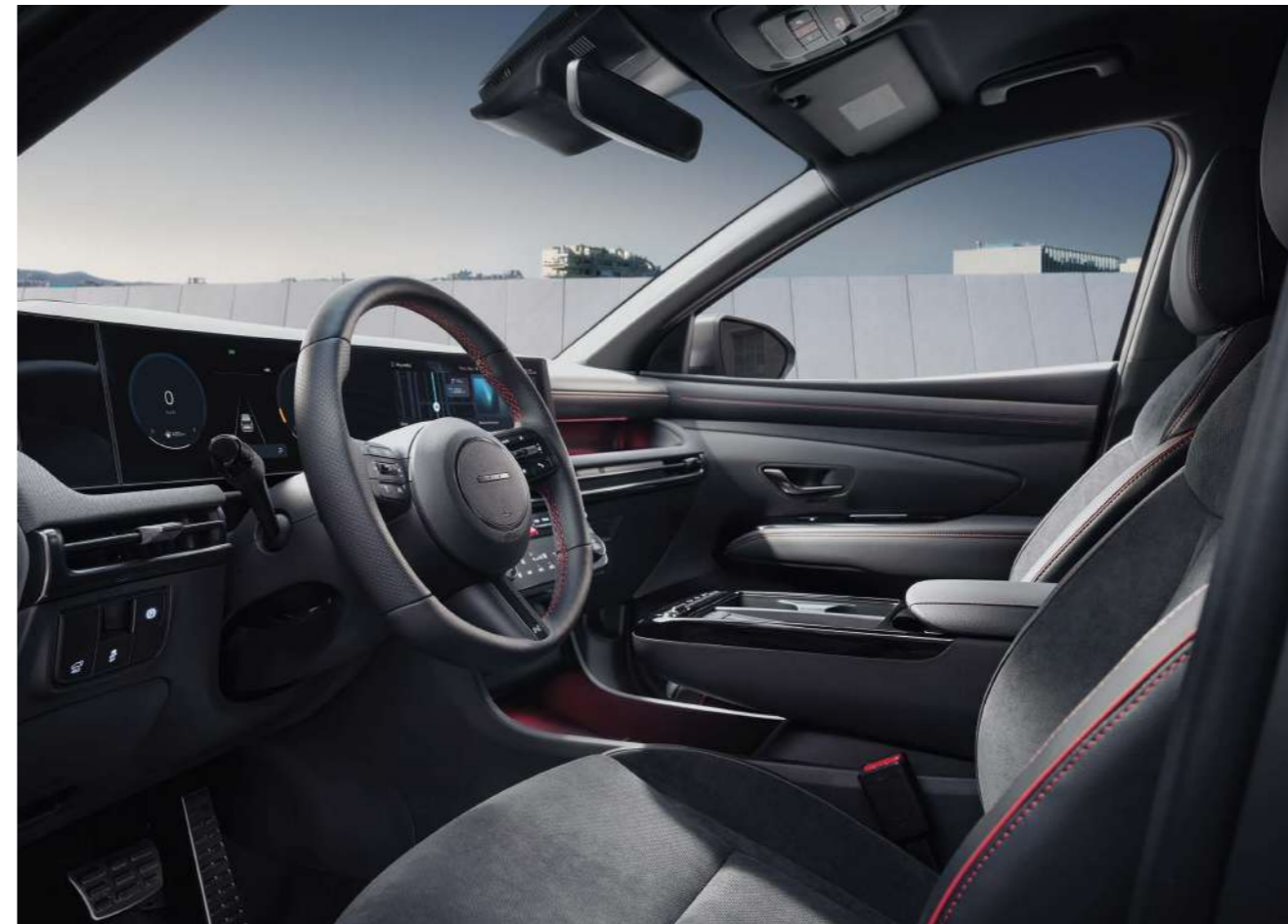
Эксклюзивный интерьер N Line (эмблема N Line на рулевом колесе / Красная прострочка)