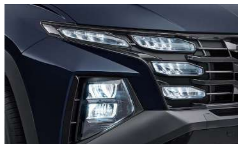
Полностью светодиодные фары головного света (MFR)