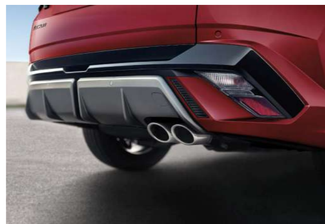
Эксклюзивные 19-дюймовые легкосплавные колесные диски N Line / Накладки в цвет кузова Эксклюзивные сдвоенные патрубки выхлопной системы N Line