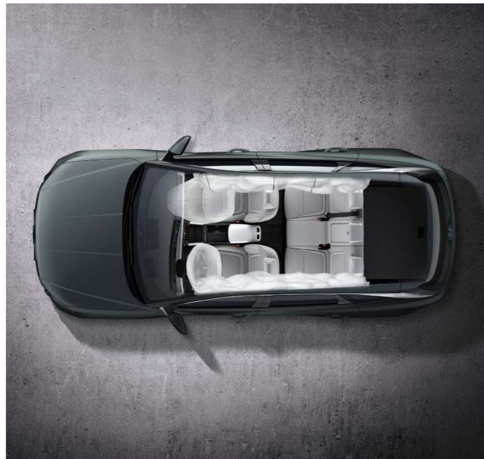
Шесть подушек безопасности