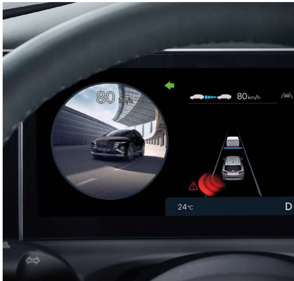
Система мониторинга слепых зон (BSM)

Новый TUCSON оснащается надежными системами, которые защищают вас от непредсказуемых событий и проверяют, чтобы вы никого не забыли в салоне.