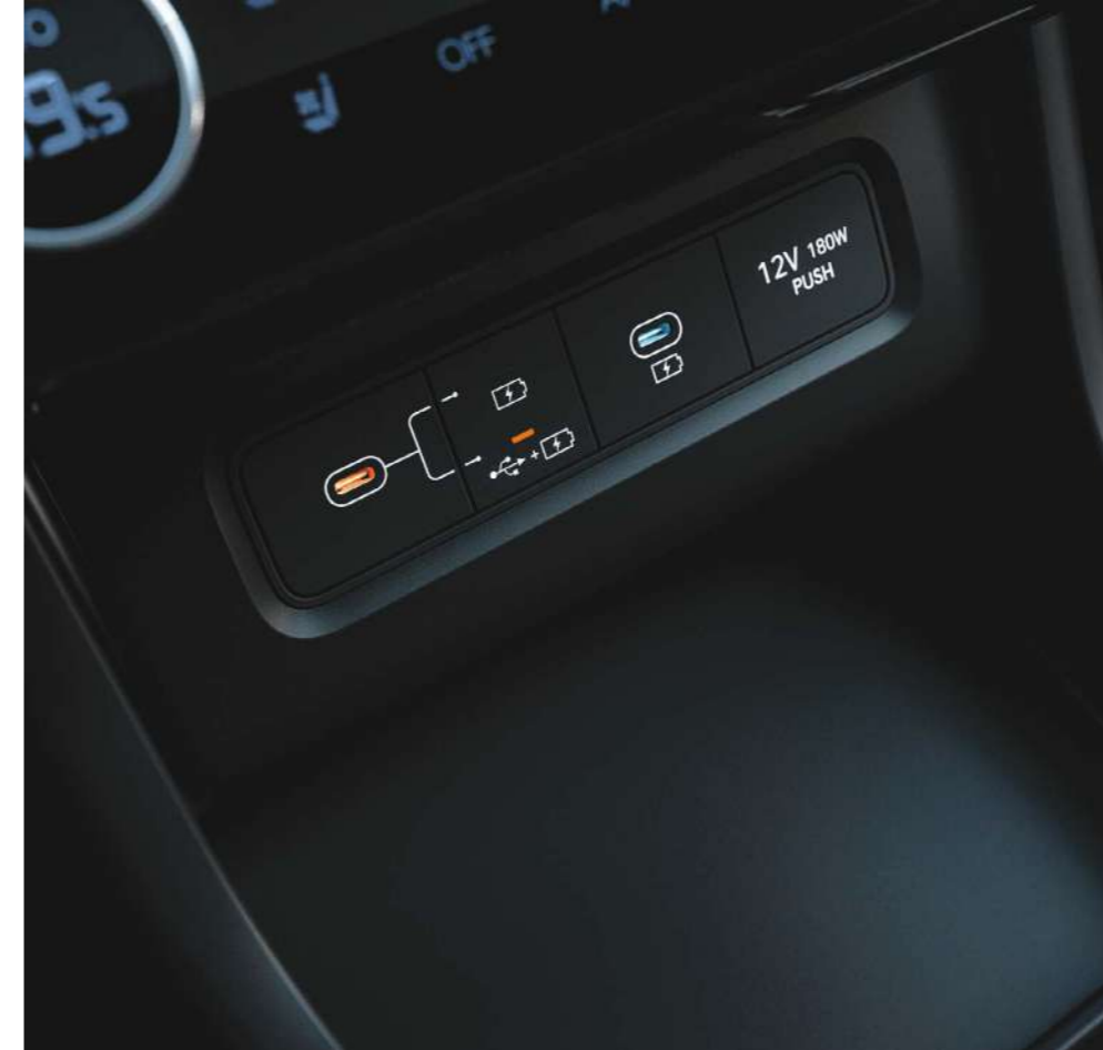
Порты USB-C для зарядки и подключения устройств