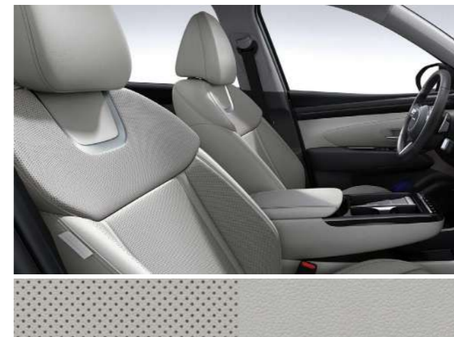
Серо-черный двухцветный (кожа)