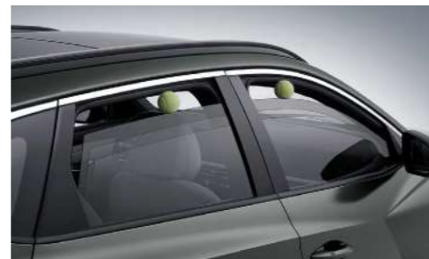
Электрические стеклоподъемники с функцией защиты от защемления