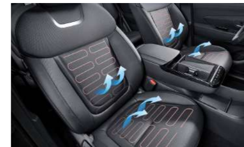
Передние сиденья с подогревом и вентиляцией