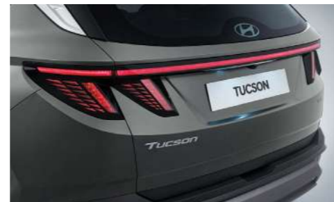
Светодиодные комбинированные задние фонари